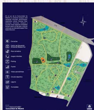
LUGARES AL SUR DE MADRID